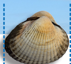
Coque 2,7 cm / 4 kg ~ 400 coques