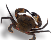
Étrille 6,5 cm