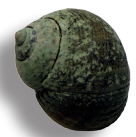
Bigorneau 3 kg ~ 500 bigorneaux