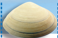
Spisule / Vénus 2,8 cm / 3 kg