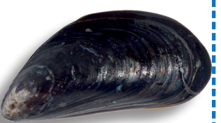
Moule 4 cm / 5 kg ~ 500 moules