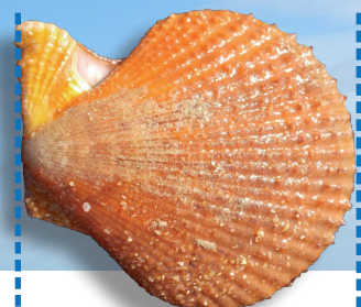
Pétoncle 4 cm / 2 kg ~ 65 pétoncles