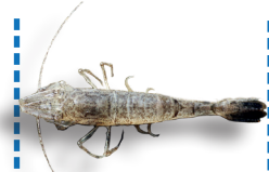
Autres crevettes 3 cm