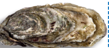
Huître 5 cm / 60 huîtres dans la limite de 5kg