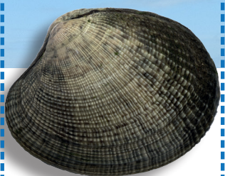
Palourde 4 cm / 3 kg Palourde japonaise 3,5 cm / 3 kg ~ 150 palourdes