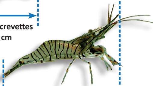
Crevette bouquet 5 cm