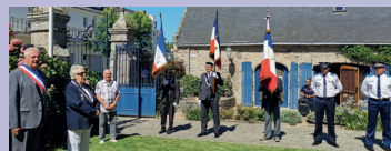
14/07 : commémorations du 14 juillet