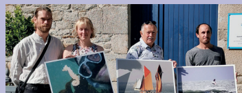
30/06 : inauguration de l'exposition photos