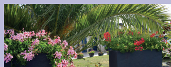
17/09 : prix du concours des Maisons fleuries