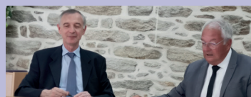
12/07 : signature du Plan Communal de Sauvegarde