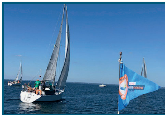
Festival des Airs Marins, du 27 août