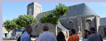
14/06 : visite conseil du label Villes et Villages Fleuris