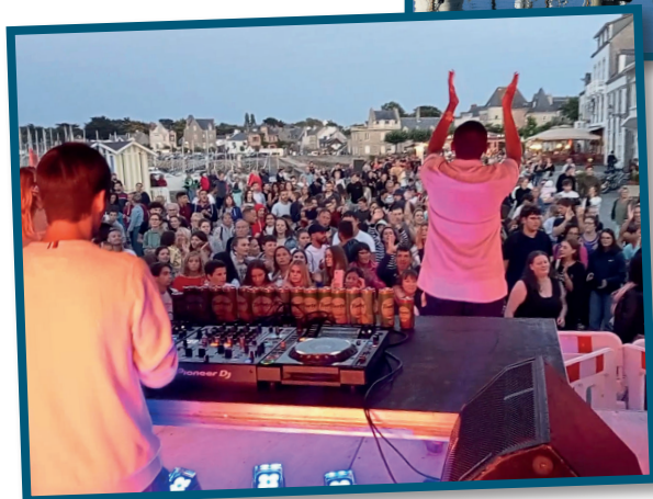
Summer tour, du 24 juillet