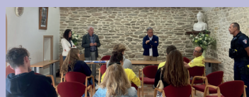
01/07 : accueil des saisonniers