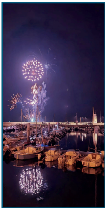
Feux du 14 juillet et 15 août

Piriacais et visiteurs ont profité d'un bel été, chaud, très chaud mais festif, animé par les associations locales et festivités organisées par la commune. Retour sur les évènements marquants !