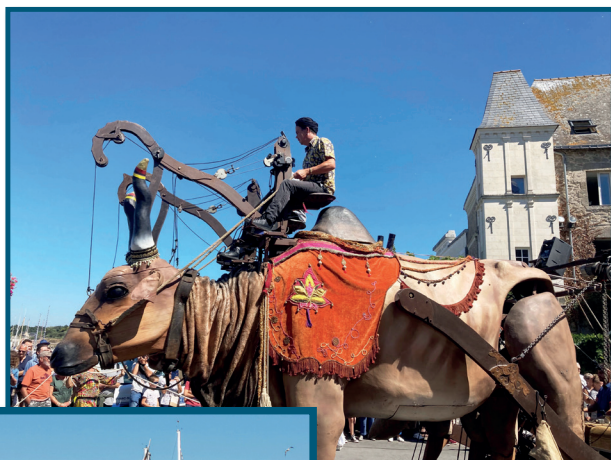
Parade du Pere Noel, du 31 juillet