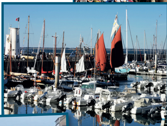
Fête du Grand Norven, du 6 août