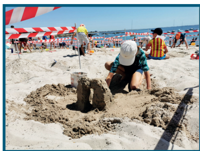
Concours de châteaux de sable, les 15 juillet et 3 août

Le Comité d'Animation et de Culture (CAC) a organisé cet été : 8 « lire à la plage », 2 concours de châteaux de sable et de dessins à la craie, 2 nocturnes des bouquinistes, 1 brocante enfants, 8 marchés artisanaux en nocturne, 1 pièce de théâtre, 8 concerts, 7 spectacles enfants et 1 concert de jeunes en réinsertion. Un grand merci à tous ses bénévoles pour leur investissement.